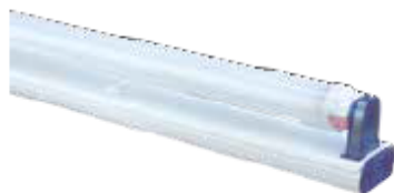
BD T8L M11/10Wx1.DA