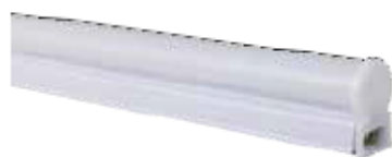
BD LT03 T5 N02 60/8W.DA