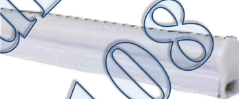
BD LT03 T5 N02 120/16W.DA