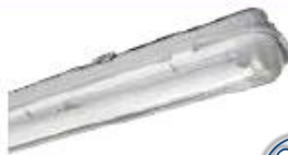
D LN CA01L/16Wx1.DA