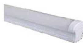
BD M18L 120/35W.DA